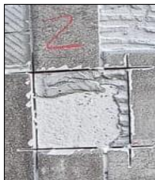
CP - 02