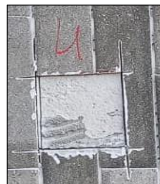
CP - 04