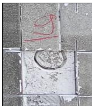
CP - 09