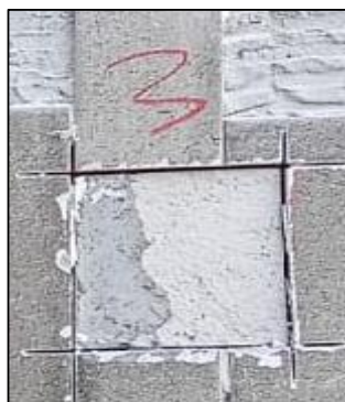
CP - 03