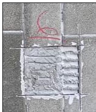
CP - 06