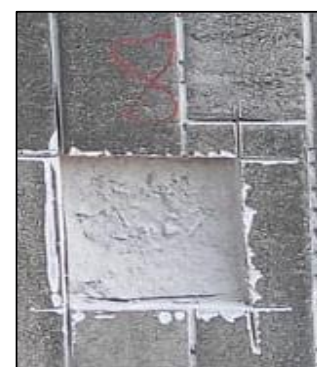
CP - 08