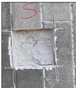
CP - 05