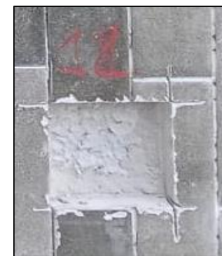
CP - 12