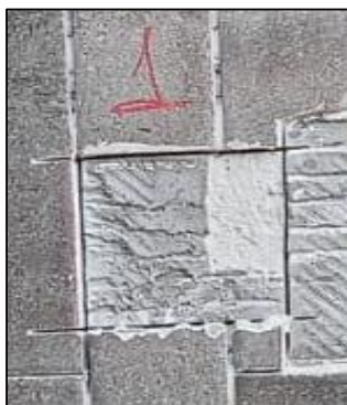
CP - 01