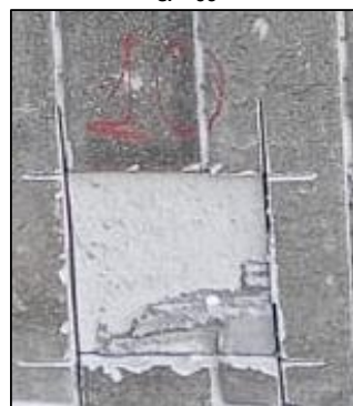
CP - 10