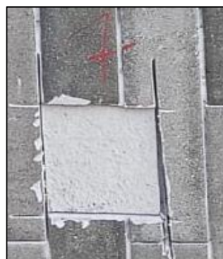
CP - 07